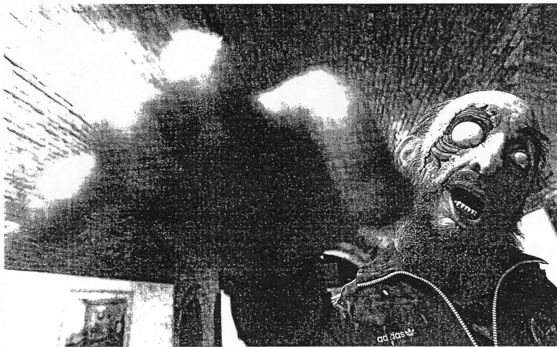
'Viva Fidel Zombie' (2008), obra de Eugenio Merino hecha con silicona, pelo humano, epoxi, poliéster, cartón; la figura mide 170 cm.

NUEVO PROGRAMA DE ARTE CONTEMPORÁNEO EN LA CIUDADELA >